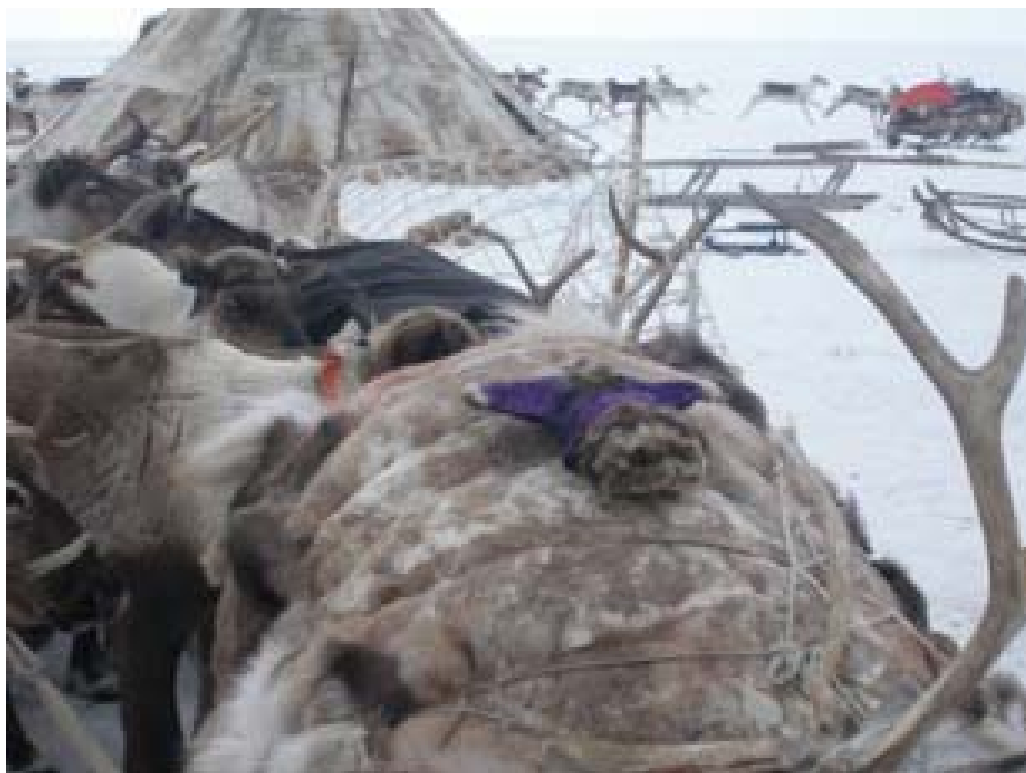
Рисунок 3. Хэута – вместо него идущий. Ярсалинская тундра