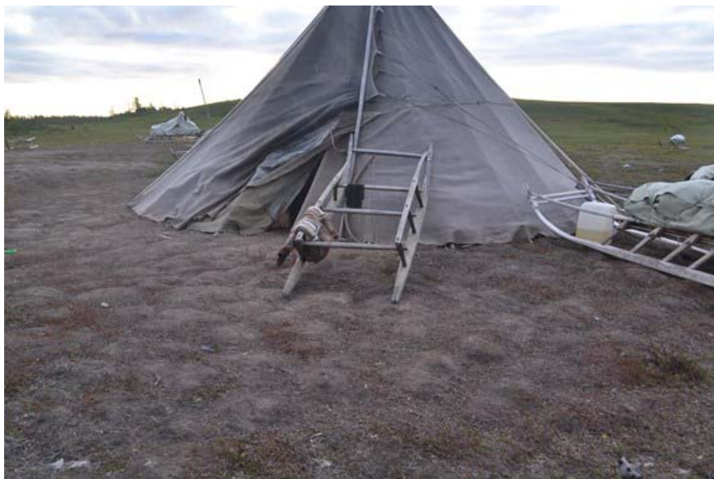
Рисунок 4. Земля, выбитая на стойбище в результате длительного проживания. Фото Е.А. Волжаниной, Ярсалинская тундра