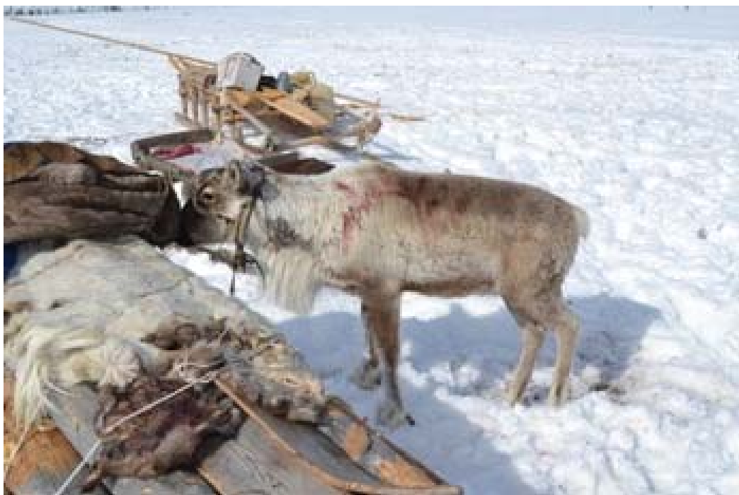
Рисунок 2. Хранители оленьего стада. Ярсалинская тундра